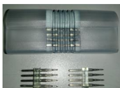
Соединительные клеммы и заглушки